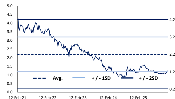
圖 3 市帳率區間