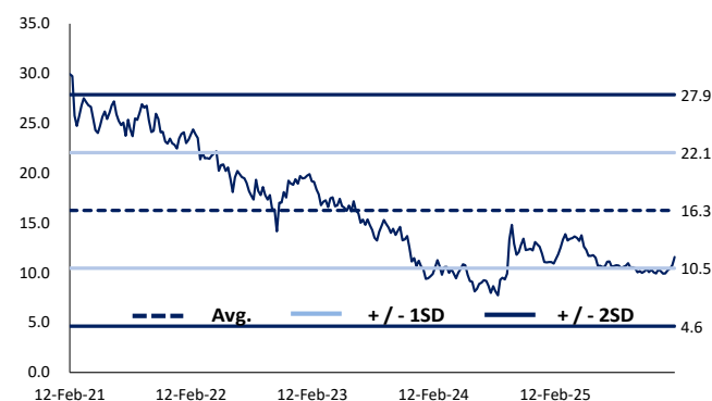
圖 2 過去 5 年預期市盈率區間