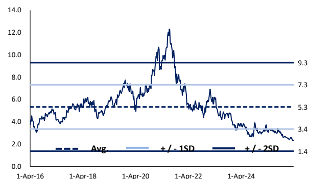
圖 4 過去 5 年預期市帳率區間