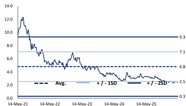
圖 4 過去 5 年預期市帳率區間