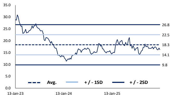
圖 1 過去 3 年預期市盈率區間

比亞迪現價吸引： AInvest 2026 年 1 月 10 日發布的 DCF 模型分析，比亞迪內在價值約 115.23 港元，較當前市場價（97.25 港元，2026 年 1 月 13 日港股收盤價格）存在 18.5% 的上升空間。比亞迪現價 2026 年市盈率為 16.3 倍，較過去歷史 3 年預測平均市盈 18.3 倍為低，顯示現價低水。根據彭博分析，目前分析師對比亞迪的平均目標價為港幣 127 元，最高目標價達港幣 174 元。