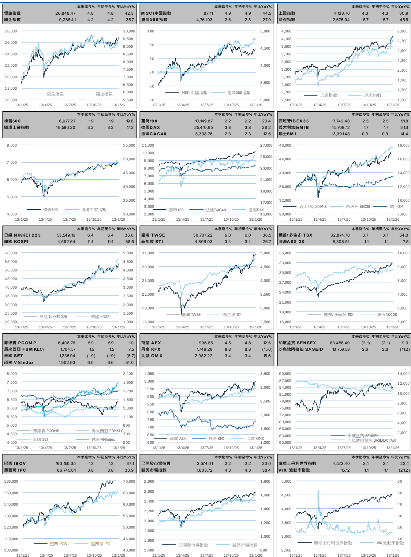
圖3 環球主要股市指數